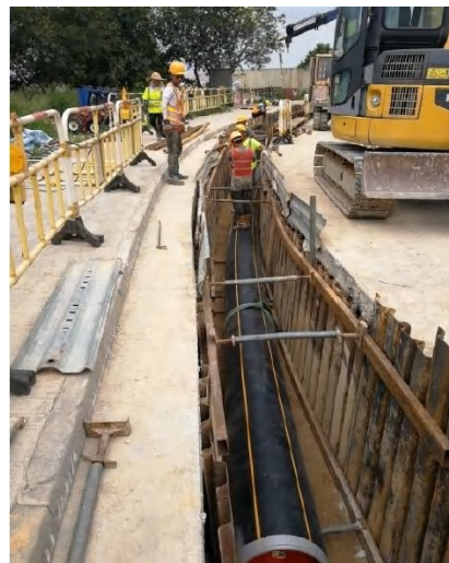
沿稔灣路鋪設輸氣管道