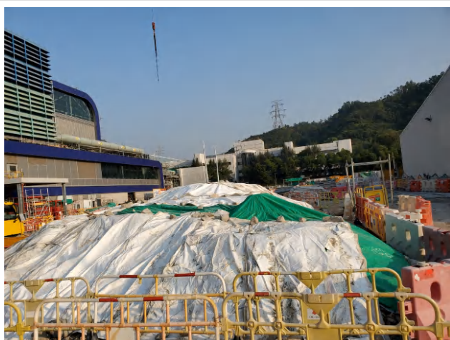
覆蓋堆存的泥料，以防止揚塵和泥面流失