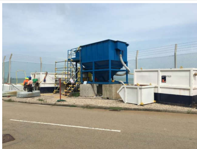
工地廢水在排放前，經過清除淤泥和廢水處理