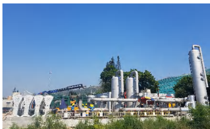
沼氣預處理系統設備運抵工地