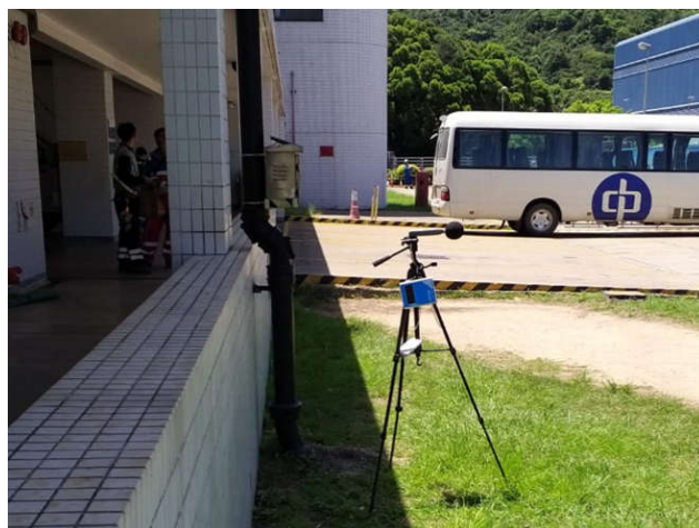
現場空氣質素及噪音水平監察