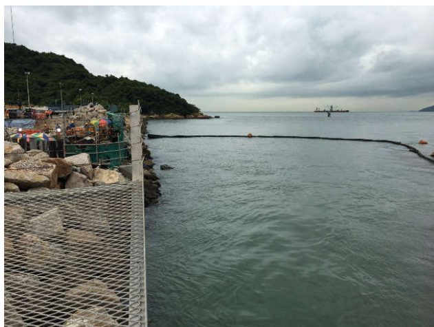
利用隔泥幕來預防和避免近海施工導至懸浮泥沙，避免影響海洋環境