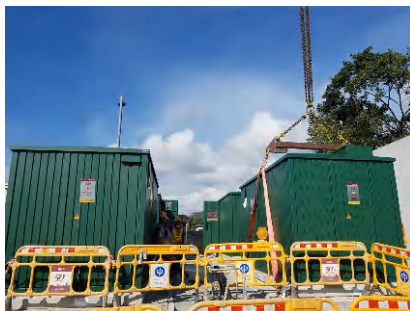
箱式變電站組合運抵工地