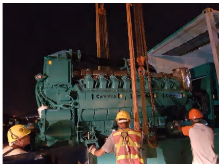
發電機組運抵工地