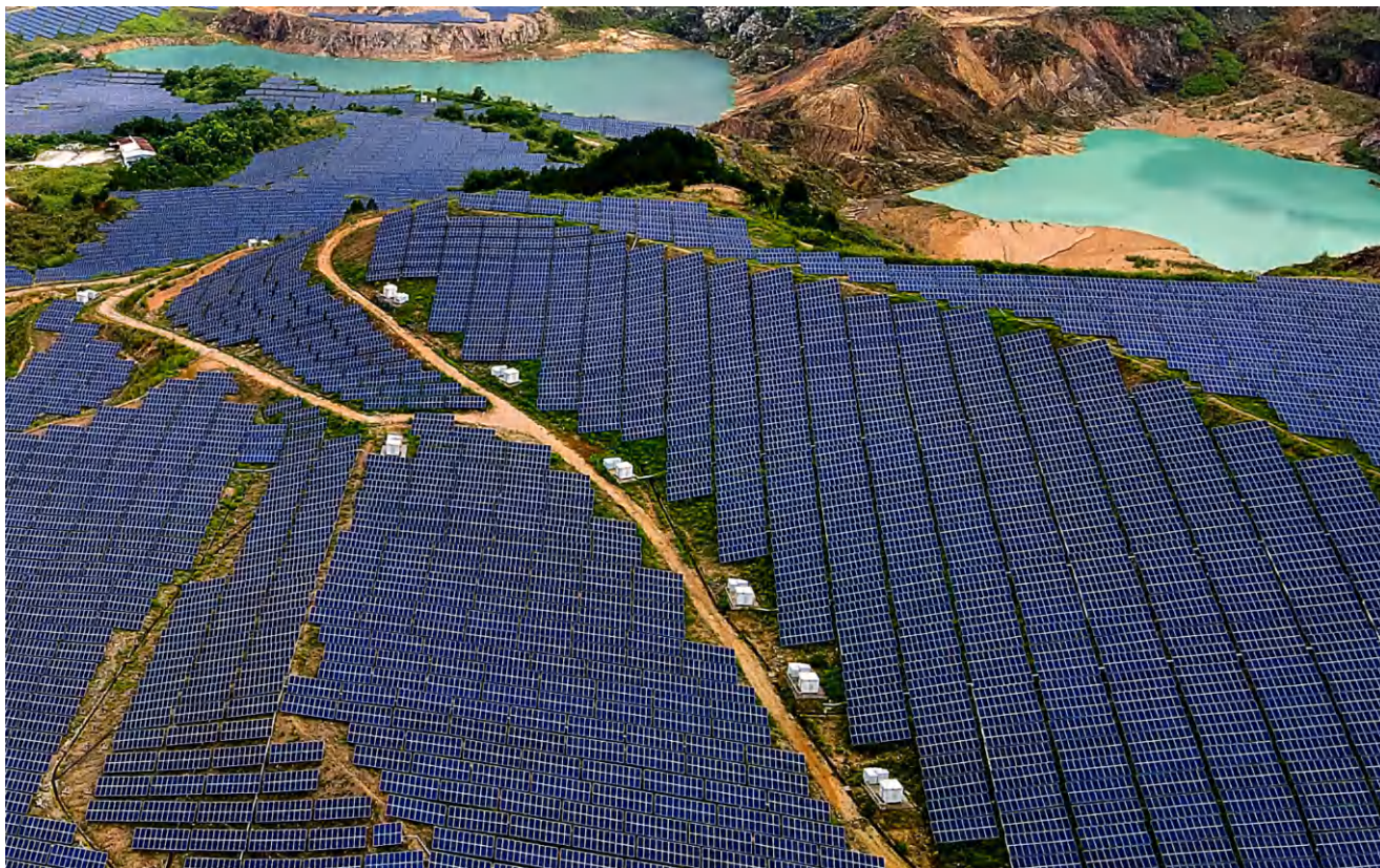
在中國內地梅州光伏電站復育約 25,000 株原生樹木，修復生態系統服務，為自然帶來長遠正面影響。

為盡量減少對環境造成的不利影響並為自然創造正面成果，中電持續加強其在支持生物多樣性、推動循環經濟及減少環境排放的承諾。中電亦正優化其重點關注範疇及相關績效指標，以更有效地管理其與自然之間的互動。中電已檢視 2025 年就氣體排放、淡水使用量及廢棄物產生量所訂立集團層面的環境目標。透過各營運資產所推行的多項環保措施，所有以 2021 年為基準年設定的 2025 年減幅目標均已達成。